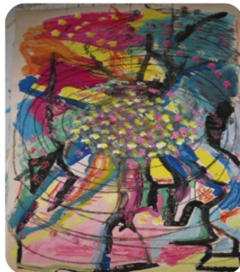
Figur 3. Det indre og det ydre forbindes ved at bruge spiralen som symbol

Ved at sammenligne det første og det sidste udtryk blev det synligt at en selvregulering havde fundet sted i det terapeutiske forløb, forstærket af at deltagerne ikke havde set deres første udtryk siden de lavede det 6 måneder tidligere. Evnen til at regulere en ubalance i bevidstheden var en af Jungs vigtigste opdagelser relateret til selvets funktion, og jeg mener i dette projekt at have påvist det selv-helende aspekt ved depression. Projektet viser, at når der gives mulighed for aktivt at forholde sig til indre konflikter, så begynder selvreguleringsprocessen at arbejde. Bevægelsen igennem egocide, indvielse og tilbagekomst, kunne findes i drømmenes temaer, kreative udtryk samt terapeutiske dialoger. Det antyder, at en dårlig livskvalitet kan blive starten på en individualisationsproces, hvilket var et af de temaer som jeg ønskede at undersøge.