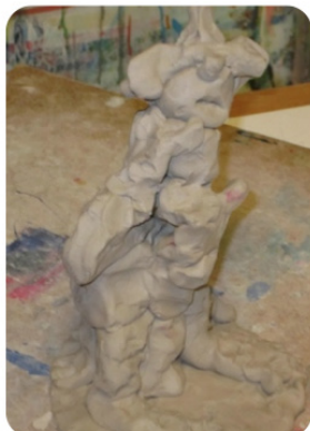
Figur 2. Figuren har en yderside og en inderside og de er ikke forbundet med hinanden. Hun viser kun ydersiden og længes efter også at vise indersiden .

Fra analysen af den terapeutiske proces hos deltagerne viste det sig at jeg-selv relationen var blevet forbedret. Det fremgik mest tydeligt af sammenligningsanalysen, hvor f.eks. det første og sidste kreative udtryk blev sammenholdt, som vist i følgende eksempel: