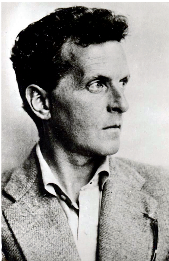
Billede 2: Den biografiske Ludwig Wittgenstein.

viser sig at hedde Paul Esterhazy (formentlig uden reference til den ungarske forfatter med samme efternavn) – en baggrund, som følger i Wittgensteins fodspor. Begge bliver i en tidlig alder nærmest økonomisk uafhængige, fordi en velhavende fader – begge af aristokratisk afstamning – efterlader en stor sum penge til sønnen. Efter at have udviklet sit filosofiske system i Tractatus vender Wittgenstein derfor filosofien ryggen for at udleve filosofien i et "almindeligt" liv, mens Kerrs Wittgenstein forlader sit studium på universitetet for også at hengive sig til "real work among real people" (Kerr: 283). Efterforskerens grafologiske un-