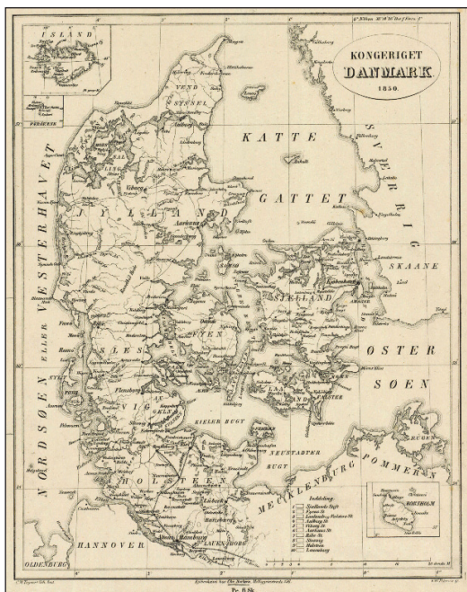
Figur 6. Det originale kort over Kongeriget Danmark 1850, som dannede grundlag for den senere reproduktion fra 1992. Kartografien i det originale kort er mindre farverig og helt uden den nationalistiske iscenesættelse i kortrammen. (Det Kongelige Bibliotek, Kortsamlingen).

rede statsretlige problemstilling bliver nedtonet, og kortet er dermed med til at reproducere et simplificeret og fejlagtigt budskab om Danmarks territoriale afgrænsning i 1850, som genfindes i den nationalistiske kartografi fra slutningen af 1800-tallet.