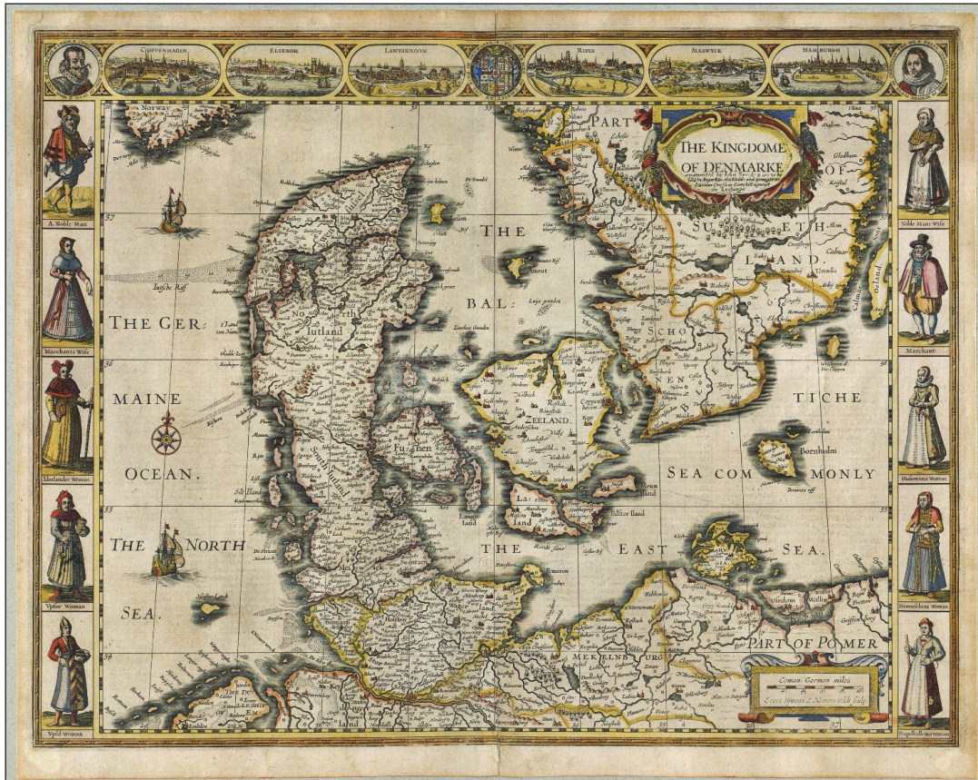
Figur 4. John Speeds kort The Kingdome of Denmake fra 1626 udgivet i atlaset "A Prospect of the most famous Parts of the World". Grafiske elementer og farvelægning er hovedårsagen til kortets store udbredelse og dets popularitet dengang og i dag.

og af kortet fremgår det, at der er tale om en: "rentegning af kort fra 1850 af Henning Dalhoff 1992, Det Kongelige Bibliotek, Kortsamlingen." Her må man imidlertid indvende, at der er tale om mere end blot en rentegning. Der er tale om en omfattende bearbejdning af det originale kort fra sidste halvdel af 1800-tallet, se figur 6. Det originale kort findes i Det Kongelige Biblioteks Kortsamling, men er uden farve og kortramme. Kortet er efterfølgende farvelagt, og tilføjet en kraftigt redigeret kortramme med prospekter, billeder og tekst, som giver kortet en helt ny mening. Slesvig, Holsten og Lauenborg er godt nok nævnt, men forsvinder i den grønne farve, som kartografisk formidler Kongeriget Danmarks udbredelse i 1850, selvom