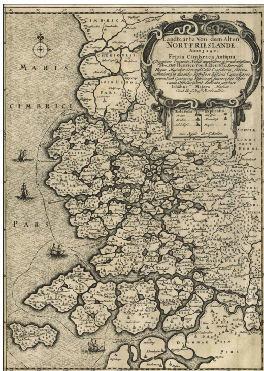
Figur 2. Landcarte von dem Alten Nortfrieslande; Anno 1240 tegnet af Johannes Mejer i 1652.

omfatte hertugdømmet Slesvig. Samtidig analyseres, hvordan brugen af kartografiske og grafiske virkemidler er med til at forstærke og udbrede denne myte. Derved vil vi søge at diskutere korts performative egenskaber - både i forhold til at formidle en bestemt version af virkeligheden og i forhold til, hvordan netop kartografiske og grafiske virkemidler er en medvirkende årsag til den forholdsvise ukritiske reproduktion af sådanne myter. Artiklen indledes med et eksempel på, hvordan kort fra sidste del af det 19. århundrede anvendtes til at understøtte budskabet om, at Slesvig tilhørte Danmark. Derefter analyseres det, hvordan denne kartografiske myte lever videre og reproduceres den dag i dag.