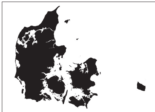
Figur 1. Kartografiske repræsentationer af staters landområde bliver ofte set som symboler på staten. Mange vil identificere figuren ovenfor som Danmark alene ud fra gengivelsen af landterritoriet. (Udarbejdet af forfatterne på baggrund af data fra Geodatastyrelsen 2016).

Kort må derfor også studeres og anvendes med samme forbehold, som gælder for eksempelvis skriftlige kilder. Det vil sige med et kildekritisk blik samt en forståelse for, at kortet ikke formidler objektive budskaber, men netop er indlejret i en bestemt agenda og formål - eller direkte produceret som propaganda for en bestemt version af virkeligheden (Pickles, 1992). Selvom dette er velkendt,