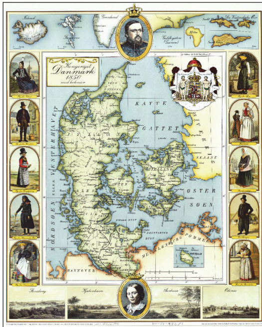
Figur 5. Kongeriget Danmark 1850 – med kolonier. Udgivet i 1992 af forlaget Palle Fogtdal. Kortet er en kraftigt bearbejdet udgave af kortet fig. 6. Billeder, prospekter og kort over kolonierne er tilføjet af forlaget i 1992.

beskriver danskernes liv i billeder fra Folkestyrets start 5. juni 1849 til Danmarks indtræden i EFs indre marked 1. januar 1993. Magasinet går frem tiår for tiår. Hvert tiår dækkes indtil videre af 4. numre. Illustrationerne er forsynet med kilderoplysninger, hvor disse har været tilgængelige, og er fra samtiden med mindre andet er anført” (“Fogtdals Illustreret Tidende – Billeder Af Danskernes Liv 1849 – 1993.”, 1992, p. 2)