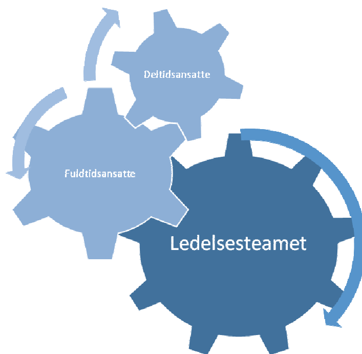
Figur 1. Tilknytning til organisationen gennem overlappende identiteter.

som ændres fra gang til gang og er afhængig af dem, vi er sammen med her og nu (Ibid.). Vi bevæger os dermed væk fra at anskue organisationens identitet som værende i besiddelse af en fast kerne. Perspektivet tager i stedet sit udgangspunkt i en mere foranderlig forståelse. Der bliver i stedet tale om flere identiteter, der griber ind i og påvirker hinanden i relationerne i en konstant udviklingstendens (Ibid.). Figuren nedenfor illustrerer denne dynamik, i form af tandhjul der arbejder sammen. I et perspektiv hvor identitet er noget, “vi gør”, bliver det fælles dér hvor identiteterne mødes og griber ind i hinanden, forstået som broer der fører os ind og ud af fællesskaberne.