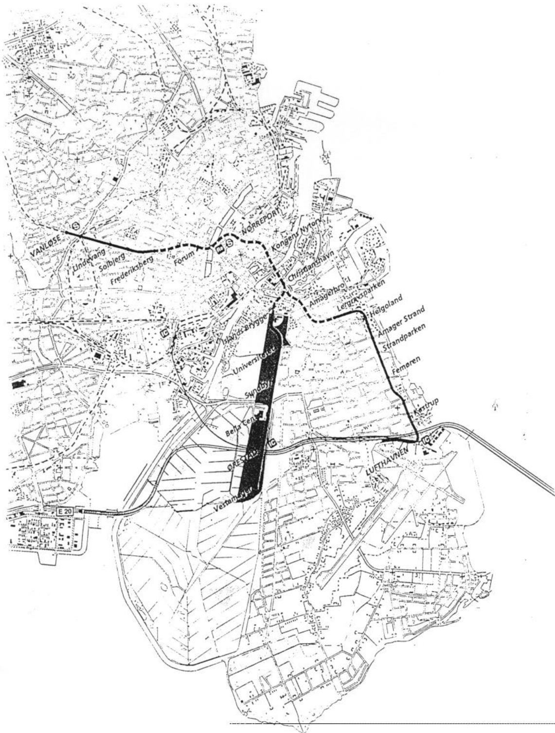
Fig: Bybanen med angivelse af de tre etaper.