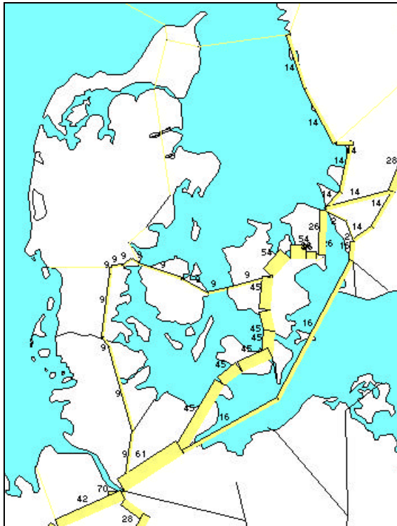
Figur 3.: Rutevalg for banetransporter ved ændrede forsinkelserantagelser

Som eksempler på anvendelsen af modellen er udbudskarakteristika for banetransporter beregnet under forskellige forudsætninger. Figur 3 viser effekten af at ændre på forsinkelserisikoen i knuder med skift. Det er antaget, at banerne er blevet betydeligt bedre til at håndtere skiftene, således at chancen er 90% for ingen forsinkelse ved en skiftetid på 1 time.