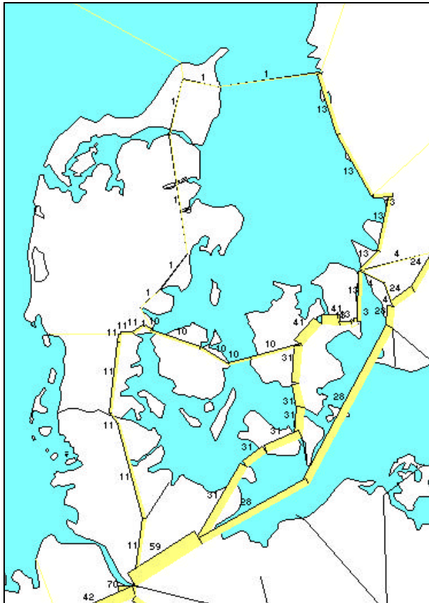
Figur 2: Rutevalg i banenettet for højværdigods

Banetrafikken i de 5 udvalgte relationer benytter 4 forskellige ruter til Tyskland, og hvilken der er mest attraktiv, afhænger af afsendelsestidspunktet og typen af gods. Afhængigheden af afsendelsestidspunktet ville ikke kunne modelleres i en frekvensbaseret model. Det anvendte link-linie koncept illustrerer derfor den større præcision, der opnås ved at arbejde med faktiske køreplaner.