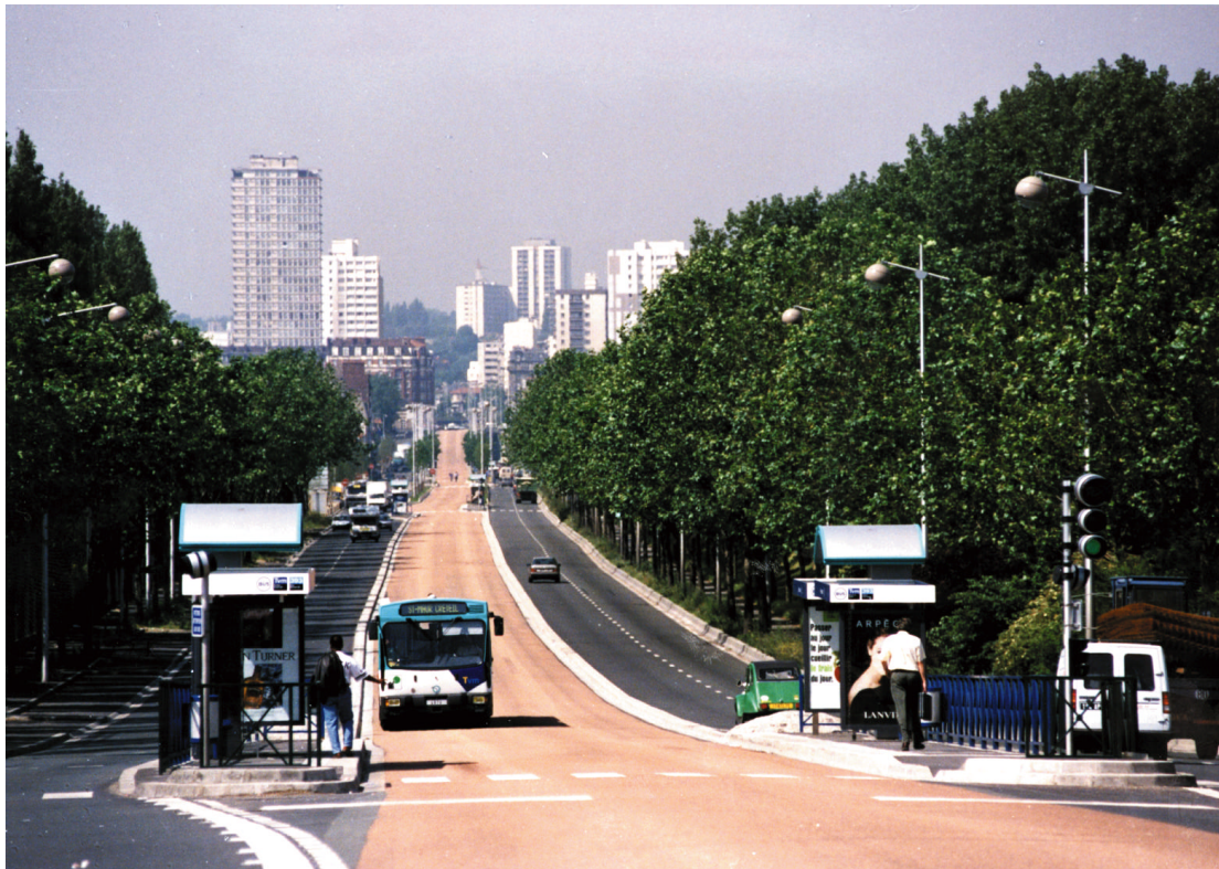
Figur 2 - Trans Val de Marne (TVM-projektet), Paris

Prismæssigt hører projektet til i den dyre ende. Dette skyldes naturligvis de omfattende infrastrukturændringer, samt at der derudover er gjort meget ud af det æstetiske ved bl.a. at plante buske, blomster og store træer.