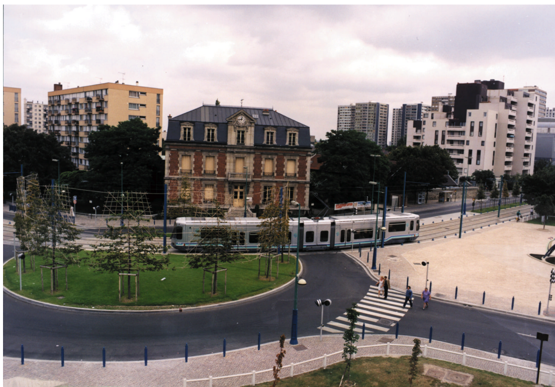
Figur 3 - St. Denis - Bobigny, Paris

Prismæssigt hører dette projekt også til i den dyre ende. I forbindelse med etablering af letbanesystemet har man anvendt ca. 13% af den totale anlægssum på æstetiske foranstaltninger.