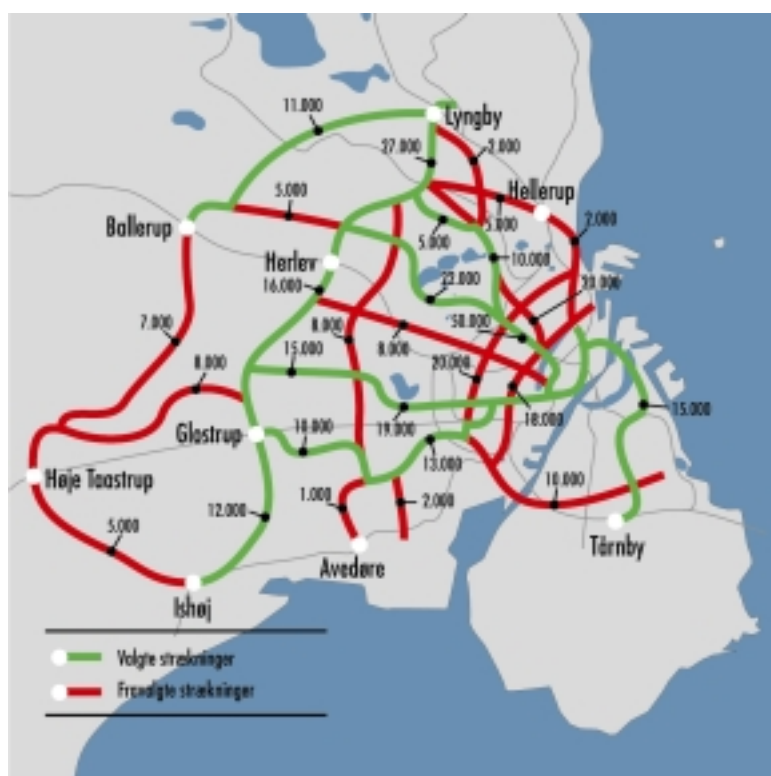
Figur 0.3-2 - Valgte/fravalgte forbindelser fra fase 2 med passagemængder

I figur 0.3-2 er for den enkelte strækning anført de maksimale passagemængder (døgntrafik snitbelastning begge retninger tilsammen), der er beregnet af trafikmodellen. Som det ses af figuren, har de fravalgte forbindelser alle relativt små passagemængder med undtagelse af Fasanvejslinien. Denne er ikke medtaget i fase 3-basisnettene på grund af de øvrige vurderingskriterier, primært konsekvenserne for biltrafikken.