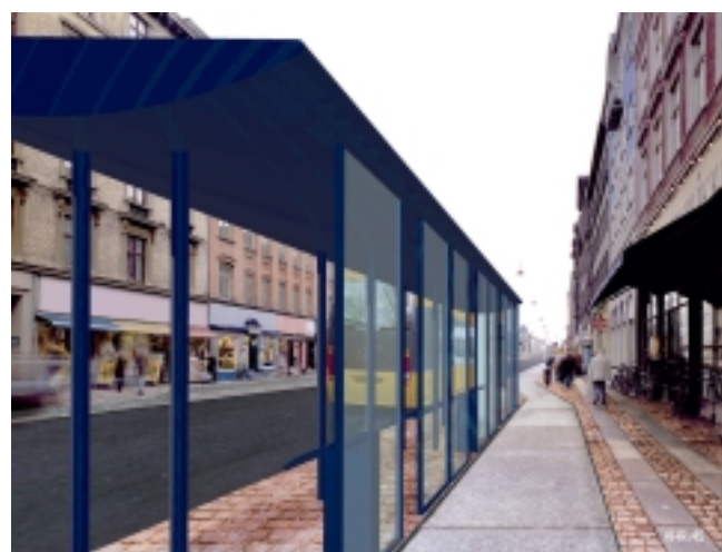
Figur 0.4-1 - De tre basisnet undersøgt i fase 3