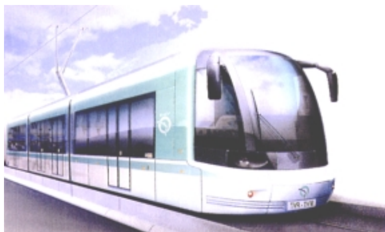
Eksempel på sporbus, TVM Paris

Den sporførte delstrækning ligger i siden af eksisterende veje og krydser andre veje i niveau i