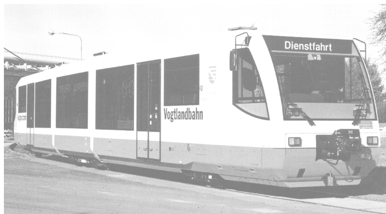
Eksempel på nærbanetog, RegioSprinter