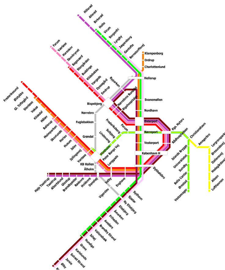
Figur 1: Linieføringskort for S-bane og metro med to nye S-banespor gennem København

For at vurdere den trafikale effekt af etablering af to nye S-banespor gennem København er der foretaget en køreplansbaseret rutevalgsberegning efter "Alt-eller-intet"-princippet. Rutevalgsberegningen foretager udelukkende en udlægning af passagerer på det kollektive trafiknet, og forudsætter derfor en kendt OD-matrice. For derfor at kunne vurdere trafikvæksten er det nødvendigt at foretage en opskrivning af OD-matricen på baggrund af forskelle i generaliserede tidsovkostninger fra sammenlignelige rutevalgsmodelkørsler 1 . Ændringerne i den kollektive trafik for morgenmyldretiden er visualiseret i figur 2.