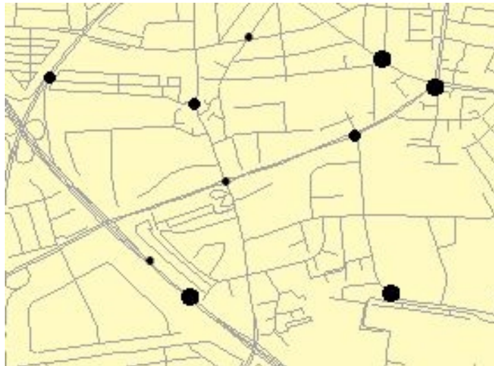
Figur 2. Sorte pletter i vejnettet. Diameteren af cirklen angiver størrelsen af stedets "sikkerhed for sorthed".

I prioriteringen af hvilke steder der skal udbedres og med hvilke midler, er det dog nødvendigt med en nøjere analyse af hvilke tiltag, der er bedst egnede mod uheldene. Der arbejdes p.t. i Carl Bro på at udvikle en metode, der inddrager stedets grad af "sorthed" i prioriteringsfasen. Dette kan f.eks. opnås ved at basere førsteårsforrentningen i (5) på stedets estimerede uheldsniveau, \mu' = \mu s , fremfor på de observerede antal uheld.