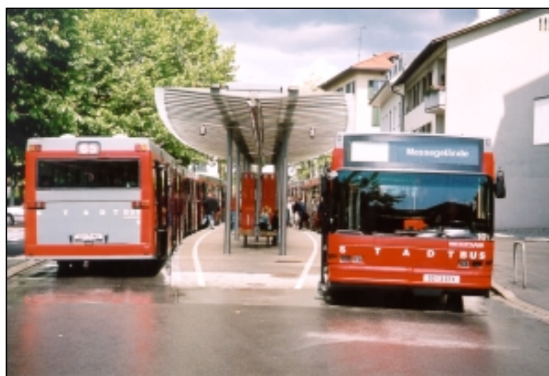
Bild 1: Stadsbussarna i den österrikiska staden Dornbirn. Alla bussar har enhetlig design utan reklam. Hållplatsen på bilden är den särskilda möteshållplatsen, där de flesta linjerna möts samtidigt för ett smidigt och enkelt linjebyte för passagerarna.

Dessutom angav många av städerna att hög andel privat bilism samt parkeringsrestriktioner lett till en ohållbar situation vad gäller parkeringssituationen i innerstäderna. Detta i sin tur har gynnat kollektivtrafiken.