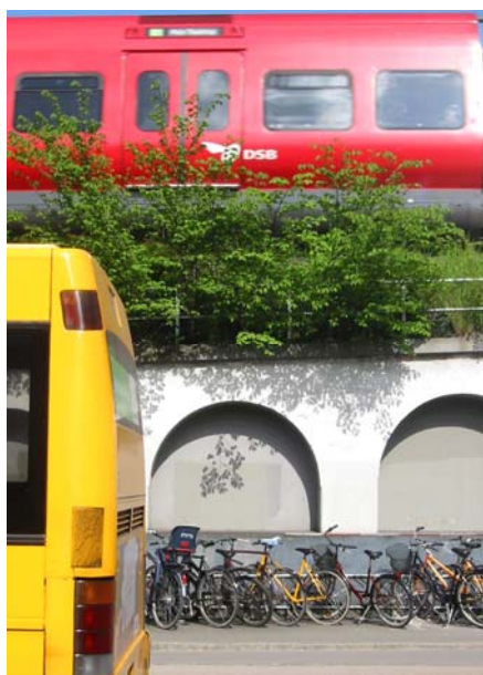
Cykler og kollektiv trafik ved Nordhavn station

Den kollektive trafiks andel af turene kan desuden fremmes gennem en hensigtsmæssig placering af byggeriet i forhold til trafiksystemets linjeføring og stoppesteder. Korte gangafstande, hyppige afgang og hurtige forbindelser er med til at gøre den kollektive trafik særlig attraktiv. Der kan forventes i størrelsesordenen 30.000 ture med kollektiv trafik pr. døgn, afhængigt af systemets udformning.