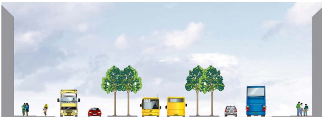
Nordhavns Allé, ca. 40 meter bred svarende til fx Strandboulevarden og Søndre Boulevard.

kurveradier, der er store nok til, at der også med tiden vil kunne etableres en metroforbindelse. Fra alléen etableres vejforbindelser til de enkelte bebyggelser i området.