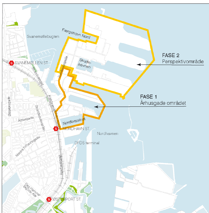
Byudvikling i Nordhavnen

I tilknytning hertil fremlægges desuden forslag til en strategi for gennemførelsen af en række tiltag (mobility management), som kan bidrage til at sikre en effektiv udnyttelse af både infrastrukturen og det kollektive trafiksystem til, fra og på Nordhavnen og dermed yderligere understøtte ambitionerne om at skabe en attraktiv ny bydel.