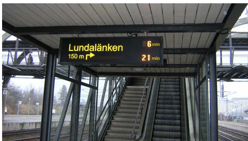
Lundalänken - gangbro og realtidsinformation ved Lund C

I udlandet har man flere steder etableret højklassede busløsninger, hvor busserne kører lange strækninger i eget tracé, og dermed får en højere hastighed og en højere regularitet. Lund er et eksempel på en by, der har valgt at etablere et sådant bustracé gennem en stor del af byen - også gennem et endnu uudbygget byområde - hvilket har resulteret i store tidsbesparelser for busserne og en stor stigning i antallet af buspassagerer på strækningen. Halvdelen af de nye buspassagerer kørte tidligere i bil.