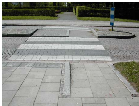
Efter: Flackare lutning, taktila plattor och kant i mitt.

Gatu- och trafikkontorets åtgärder genomfördes i två omgångar. Efter de första åtgärderna gjordes en sammanställning och en utvärdering. Detta gav möjligheter till förbättringar inför det fortsatta arbetet och att underlaget för kostnads kalkylen för fortsatta åtgärder förbättrades väsentligt.