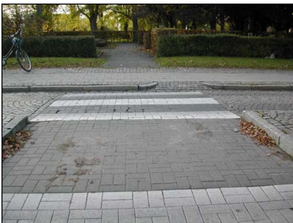
Före: Övergångsställe med branta lutningar på avfasningarna och avsaknad av taktil information samt kant i mitt..