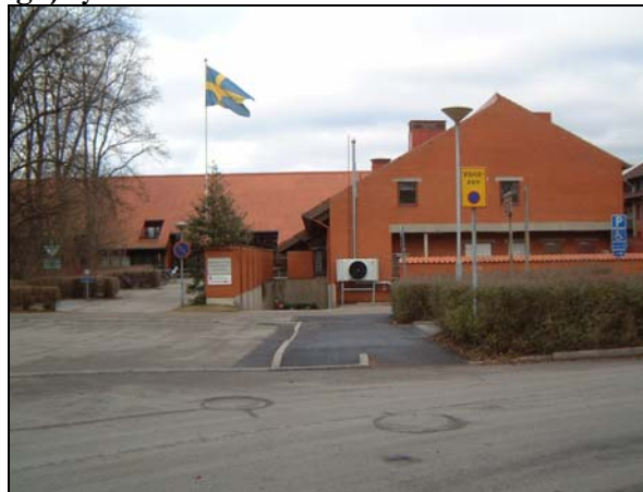
Efter: Breddad gångbana med avfasning.