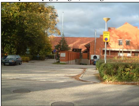
Före: Smal gångbana med kraftigt tvärfall och ojämnheter, avfasning saknas.