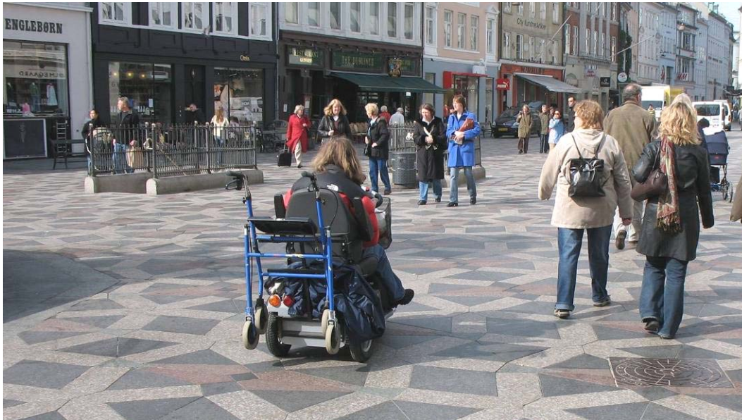
Figur 3: Amagertorv på Strøget er en af de udvalgte, som indgår i tilgængelighedsruten.

Et andet eksempel er Rådhuspladsen, som omkranses af 2 rækker granitbordur med huggede chaussésten imellem. For at kørestolsbrugere skal kunne færdes optimalt skal belægningens overflade være jævn netop der, - og hvordan gør man det uden at ændre væsentligt på hele pladsens omkransende belægning?