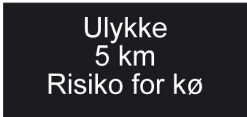
Figur 0 Eksempel på variabel teksttavle

Variable teksttavler kan være rettet mod: