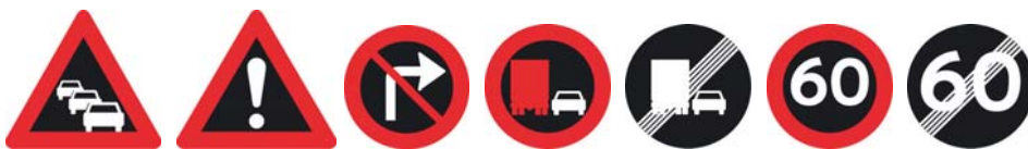
Figur 2 Variable færdselstavler.

Variable færdselstavler gælder normalt alle trafikanter eller alle førere af særlige køretøjstyper og skal kun aktiveres i forbindelse med forhold, der er afhængige af vej- eller trafiksituationen.