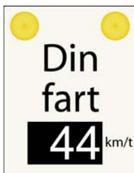
Figur 5 Elektronisk fartviser

Elektroniske fartvisere er rettet individuelt mod alle trafikanter og opsættes til vejledning af trafikanter inden for tættere bebyggede områder samt på veje med lokal hastighedsbegrænsning. Vejledningen gives på særskilte tavler.