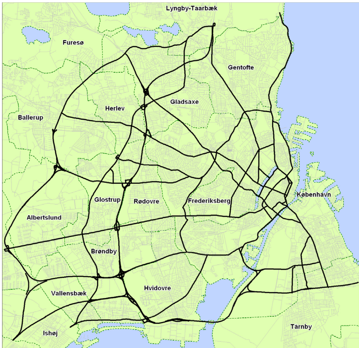
Figur 1 Vejnet til beregning af rejsehastigheder i testfase.

Udvidelse af systemet til at omfatte flere strækninger sker enkelt ved, at de nye delstrækninger defineres og indlæses i systemet. Det kræver hverken ændringer hos køretøjsflåden eller nye fysiske installationer rundt på vejnettet. Systemet er på den måde universelt, og kan benyttes til opsamling og beregning af rejsehastigheder et vilkårligt sted i verden. Det kræver blot indlæsning af vejnetsdefinitioner og en køretøjsflåde, der transmitterer positionsdata.