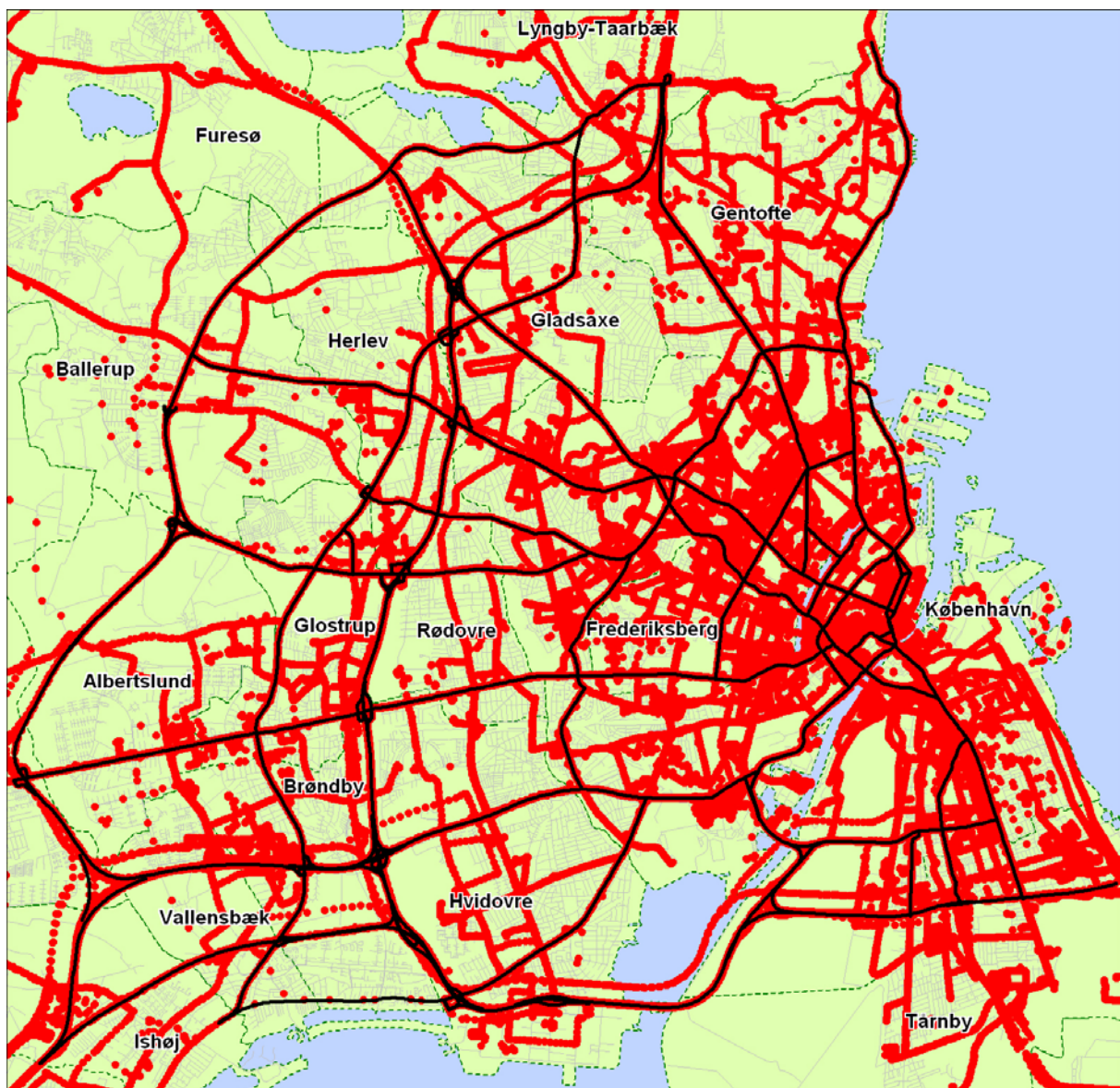
Figur 2 Eksempel på optegning af rådata fra 3x34's kørsel omkring København.

I perioden februar - juli 2007 har systemet kørt den første løbende test på 8 køretøjer. Fra disse køretøjer er der hvert 10. minut indhentet rådata. Disse er efterfølgende behandlet i systemet til beregning af rejsehastigheder.