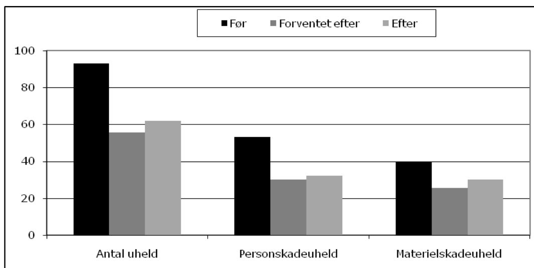
Figur 3. Figuren illustrerer størrelsen af korrektionerne i forhold til den opnåede effekt.

Dette understreger vigtigheden af, at der opnås store og tydelige ændringer i uheldsforekomsten, såfremt der skal konkluderes sikkert på evalueringens resultater. Dette er imidlertid ikke tilfældet, da effekterne er små og korrektionerne store.