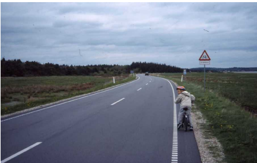
Fig. 2: Cykelrute N 12 Limfjorden rundt ved Vitskøl Kloster - ikke særlig trygt for små cyklister.

I manualen Bedre Cykelruter indgår et forsøg på en vurdering af de turist- og servicemæssige kriterier så som overnatning, proviantering, service, landskab og seværdigheder. Noget sådant har ikke