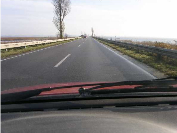
Fig. 1: Dæmningen mellem Bogø og Møn. Her går 1 international cykelrute (Berlin - København), 2 nationale cykelruter (8 og 9) og en regional (58). Der er en årsdøgntrafik på ca. 3000 biler. Ikke trafikikkert nok.

Eksempelvis har kommuner og amter haft frit slag til at benytte veje med en hel del biltrafik, som dele af en cykelrute, uden at etablere cykelstier langs disse veje.