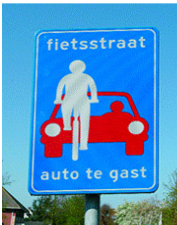
Fig. 4: I hollandske byområder kan man finde denne tavle, som betyder at biler ikke på overhale cyklister!