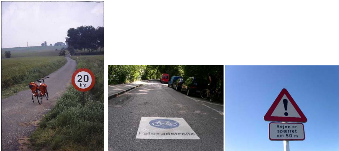
Fig. 3: Cykelrute i Flandern, hvor biler max må køre 20 km i timen samt "Fahrradstrasse", Tyskland. I Danmark savnes afprøvning af værktøjer til ændring af veje til cykelruter. Men vejlukninger kunne koordineres med planlægning af sammenhængende cykelmuligheder.

foreligget indtil i dag. Dog er CyclingDenmark ( www.visitdenmark.com/cycling ) begyndt at kvalitetsbedømme overnatningssteder ud fra cyklisters forventede behov, ligesom det har været tilfældet i nogle andre lande, så som Norge, Tyskland og Østrig.