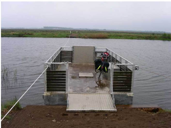
Fig. 6 :Trækfærgerne over Skjern Å giver ekstra oplevelser undervej.

Rapporten "Bedre Cykelruter" kan findes på www.vejsektoren.dk http://www.vejsektoren.dk/wimpdoc.asp?page=document&objno=170966