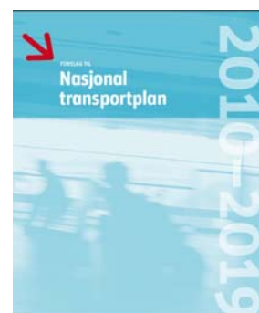
Forside NTP 2010-2019

Transportavstand mellom ulike soner og kjørehastighet for de ulike kjøretøyene er viktig for å kunne beregne reisetid mellom par av soner.