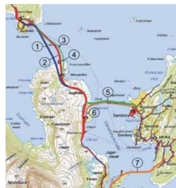
Illustrasjon fra HB 140

Ved bygging av en ny veg, eller annen endring i vegsystemet, vil det kunne bli endring i total reisetid fra før- til ettersituasjon. Fartsmodellen kan benyttes for å beregne gjennomsnittsfart og reisetid for de enkelte lenkene i systemet i både før og ettersituasjonen. Det kan på bakgrunn av det regnes ut total reisetid og differanse mellom før- og ettersituasjon