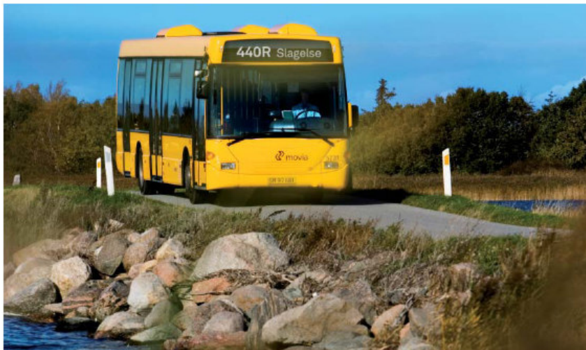
R-nettet forslag til fremtidens hovednet i Region Sjælland

Og i hovedstadsområdet blev indførelsen af S-busser i begyndelsen af 1990'erne en stor succes.