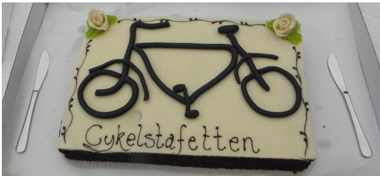
Der blev serveret cykelkage i forbindelse med opstarten.

Det viste sig mere end vanskeligt at få engageret medierne til at følge kampagnen. Trods vedholdende og gentagende kontakt til lokalaviser, radio og TV, var der minimal interesse for at bringe noget.