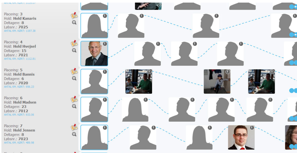
Ranglisten blev vist grafisk med fotos af en del af deltagerne.

Langt hovedparten af deltagerne valgte ikke at uploade portrætbilleder på ranglisten, hvilket var ærgerligt for sitets værdi. Det var klart mest interessant at følge med i persongalleriet for de hold, der havde flest billeder på listen.