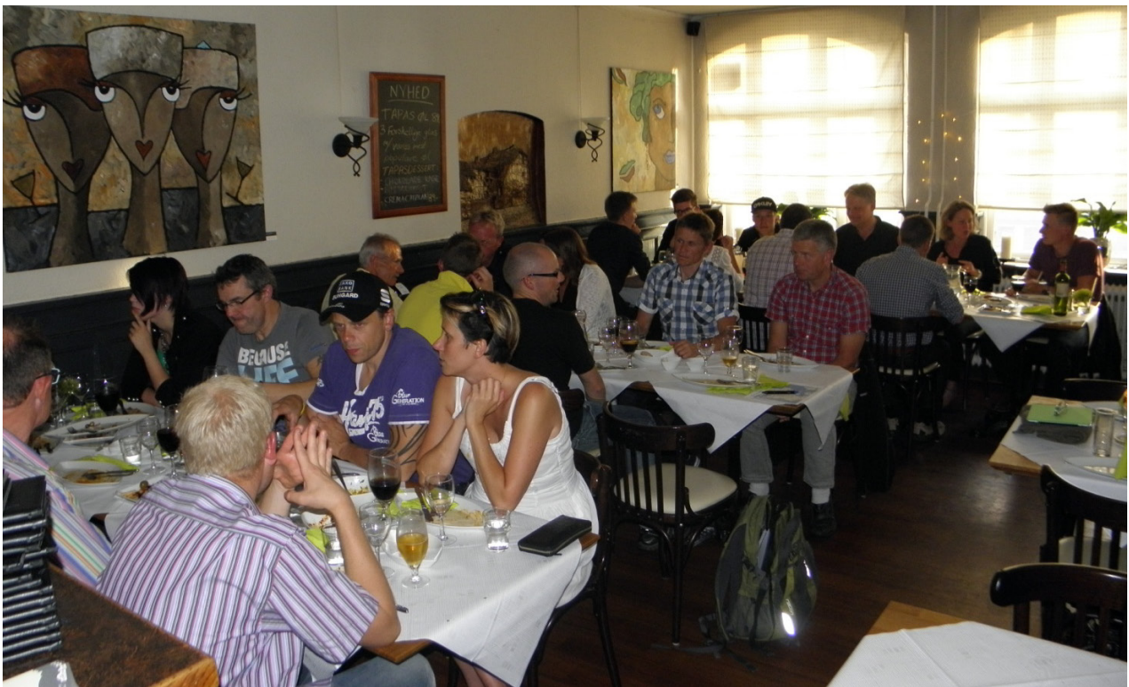
Vinderholdet fik en fælles middag som præmie.