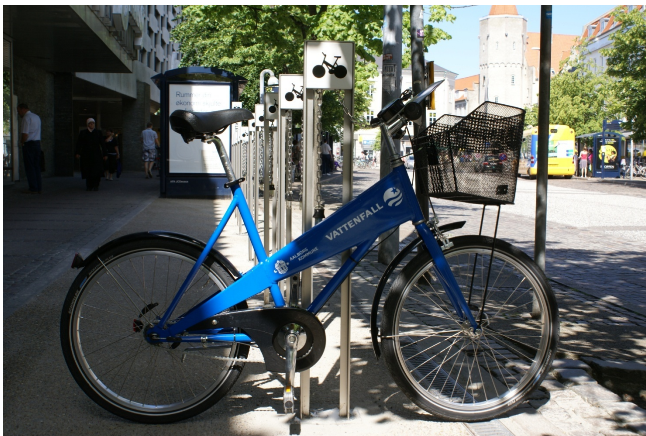
En Aalborg Bycykel ved en af byens 21 bycykelstationer.