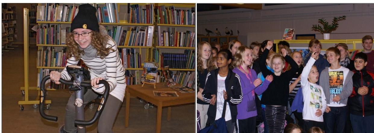
Elever skulle undervejs bl.a. køre point ind på en motionscykel. Til højre ses de glade vindere af konkurrencen i 2011.

Som evaluering af kampagnen er der gennemført spørgeskemaundersøgelser blandt alle i målgruppen på de involverede skoler. Evalueringen viser samtidig, at kampagnen har været i stand til at fange elevernes interesse. Over 75 % af eleverne i målgruppen angiver, at de kender kampagnen og omkring 23% har begge år været aktive i kampagnen. Besøgende på kampagnens hjemmesider har begge år i snit brugt 4 ½ min på hjemmesiden og besøgt ca. 11 af hjemmesidens undersider. Denne besøgstid er relativ lang for en hjemmeside. Sammenholdt med, at der begge år var stigende besøgstal igennem kampagneperioden indikerer, at børnenes interesse blev vagt og fanget undervejs i kampagneforløbet.