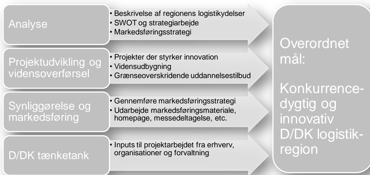
Figur 2. Aktiviteter i CB-log projektet

Projektets 4 hovedaktiviteter fremgår af nedenstående figur 3.