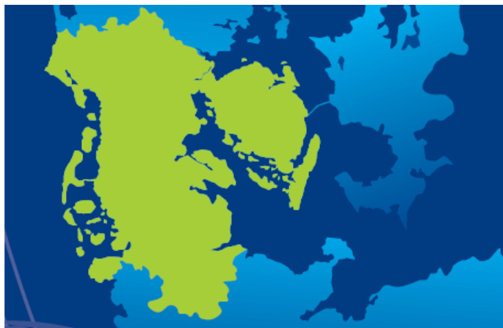
Figur 1. CB-log regionen

Cross-border logistik regionen (CB-log regionen) omfatter på dansk side hele Region Syddanmark. På den tyske side omfatter den det område, der er støttet af projektmidler fra INTERREG 4a , bestående af kredsene Nordfriesland, Slesvig-Flensborg og Rendsborg-Ekernförde, såvel som de kredsfrige byer Flensborg, Neumünster og Kiel. Det samlede område dækker et areal på 18.788 km 2 og huser 2.240.920 danskere og tyskere. Den danske og den tyske del af CB-log regionen har stort set samme inbyggertal.