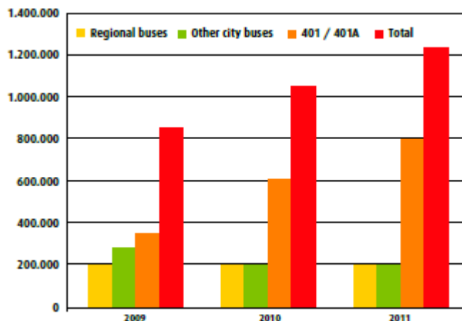
Billedtekst – Passagerfremgangen i Ringsted Kommune.

Ved at styrke samarbejdet i sektoren har projekterne vist, at man kan: