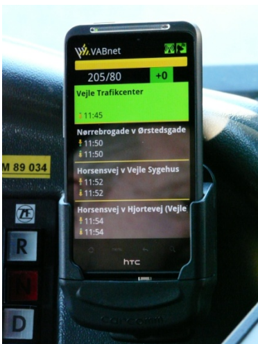
Figur 2. Smartphone i busserne

Realtidsdata indsamles i busserne ved brug af smartphone med en applikation, hvor buschaufføren ved start logger ind på den linje og rute, der aktuelt skal køres.