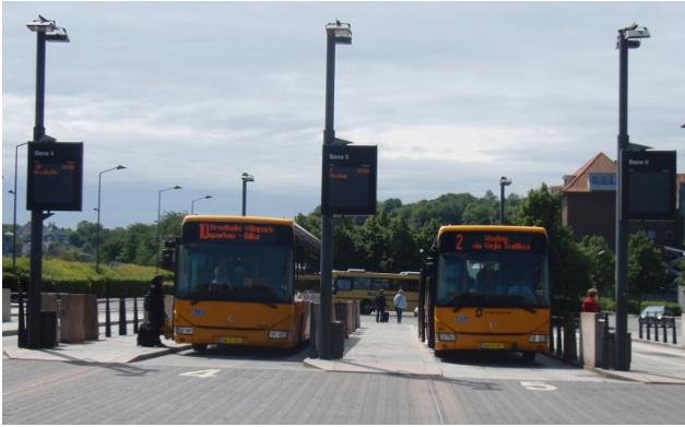
Figur 3 Infotavler i banerne Vejle Trafikcenter

På Vejle Kommune besluttede i forbindelse med det gamle informationssystem at bane 1 – 3 er reserveret til lokal- og regional busser. Bane 4 – 7 er reserveret til bybusserne. Systemet anviser ud fra regler busserne til disse baner. Passagererne får inden busser kommer oplyst på skilte dels i banerne dels ved store informationstavler, hvilken bane bussen kører i. Chaufføren har dog via telefonen mulighed for at ændre bane, hvis den anviste bane af en eller anden årsag er spærret.