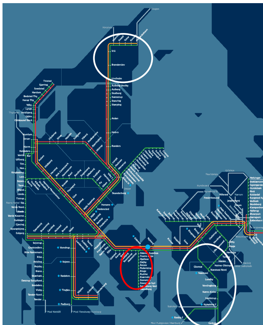
Figur 3 – Linjestructur for regional- og fjerntog i Danmark.

(Hansen et al. 2006) viser, hvordan en indledende køreplansændring i den nordlige del af Jylland påvirker køreplanen for regionaltog i den sydøstlige del af Danmark (se figur 3). Dette sker da hastigheden opgraderes på den enkeltsporede strækning nord for Aalborg og køretiden som følge af dette reduceres. På grund af denne køretidsændring og da strækningen er enkeltsporet skal krydsningerne ændres på strækningen for at opnå køretidsbesparelsen. Da de tog, der kører på strækningen er en del af det landsdækkende IC-system, breder den indledende køreplansændring sig til andre toglinjer i netværket, der er afhængige af IC-service, f.eks. de regionale tog, der kører København-Nykøbing F i den sydøstlige del af Danmark. Hvor gode korrespondancer eksisterer, vil den indledende køreplansændring forværre korrespondancer, såfremt den forbindende toglinje ikke kan omlægges. På den anden side kan der også være fordele, hvor en dårlig korrespondance kan blive forbedret på grund af den indledende køreplansændring.