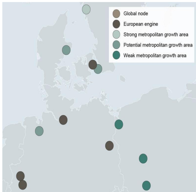
Figur 2 ESPON's klassifikation af byer i Nordeuropa