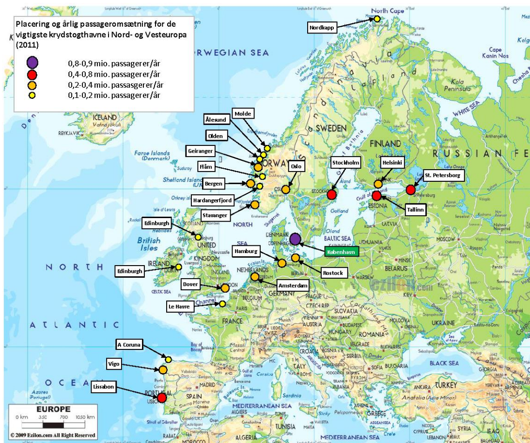
Figur 3 Placering af de vigtigste krydstogthavne i Nord- og Vesteuropa