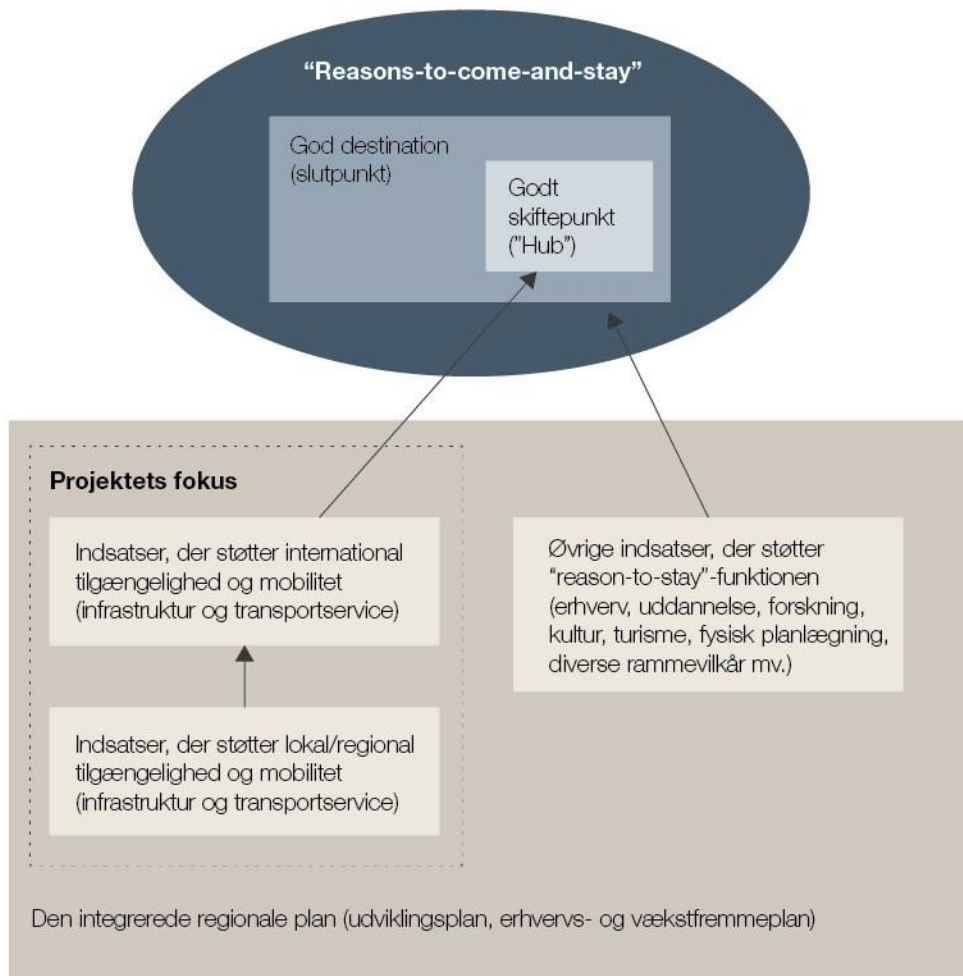
Figur 1 Resulterende opfattelse af forholdet mellem "hub-" og "destinations-" funktionen