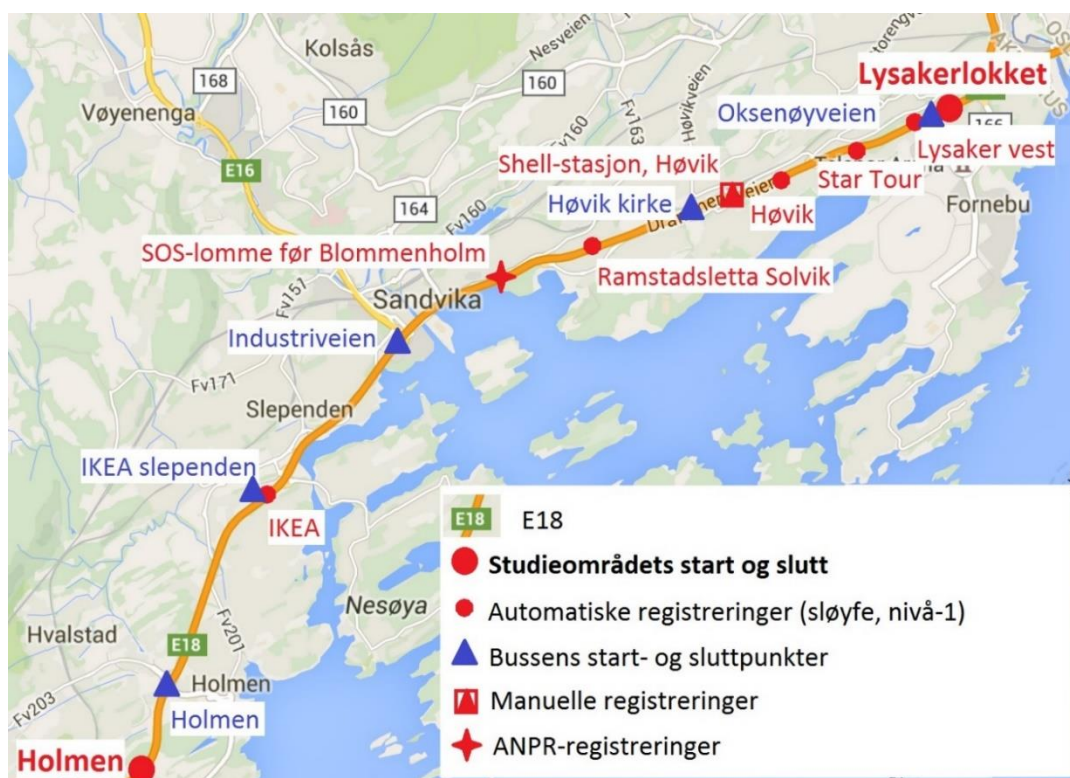
Figur 2 Oversiktskart over de ulike tellepunktene Holmen-Lysakerlokket

For å undersøke i hvilken grad elbilen forårsaket bussenes forsinkelser ble det brukt manuelle og automatiske kjøretøysregistreringer for å sammenligne antall kjøretøy som benyttet kollektivfeltet på strekningen med kapasiteten til feltet (utnyttelsesgraden). Disse ble deretter sett i sammenheng med reisetiden til enkelte busser på strekningen i samme tidsrom for å se i hvilken grad de var forsinket. Arbeidet er basert på datamateriale mottatt fra Statens Vegvesen Vegdirektoratet og Ruter AS, og registreringsmetodene er nærmere beskrevet i de påfølgende delkapitlene. En oversikt over hvor de ulike tellepunktene for studieområdet befinner seg og hvilken registreringstype det er, er vist i Figur 2.