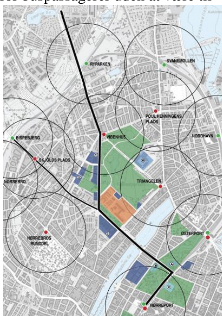
Figur 1 - Vidensbydel Nørre Campus med markering af 600m stationsoplade

Selve byggeriet af Den Kvikke vej medførte at mange passagerer i busserne valgte andre transportmidler på strækningen. I 2014 og 2015 indgik parterne omkring Den Kvikke Vej derfor i et storstilet samarbejde om at informere potentielle brugere om fordelene ved Den Kvikke vej samt sikre trafikinformation de steder hvor brugerne var. Markedsføringens formål har været at forstærke og fremskynde effekten af den forbedrede infrastruktur for busserne, så flere passagerer tager bussen til og fra Nørre Campus.