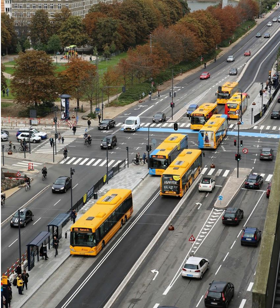
Figur 3 - Bustracé med perroner og busser.