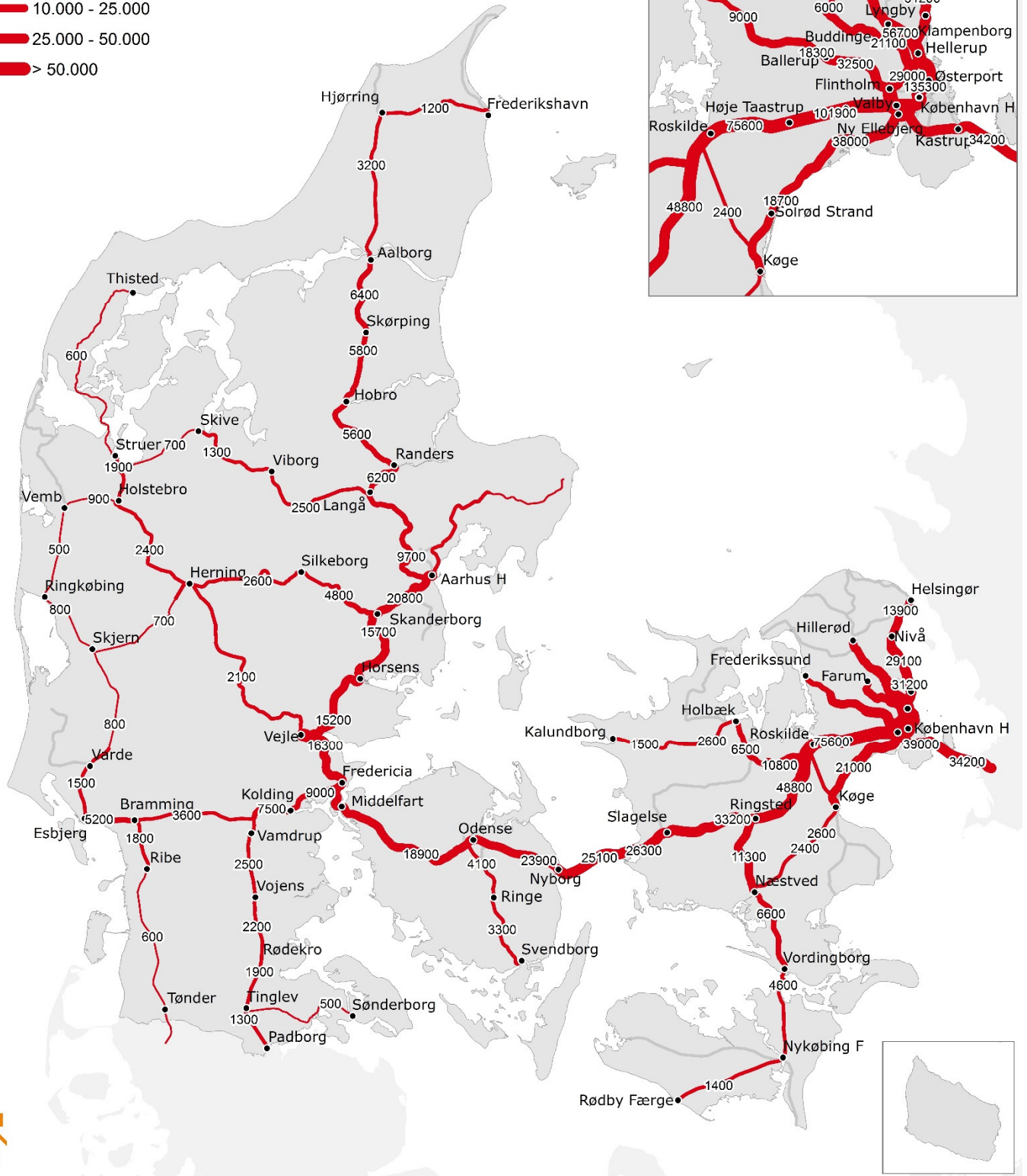
Figur 3 – Eksempel på hverdagsdøgntrafik efter genberegning i LTM.