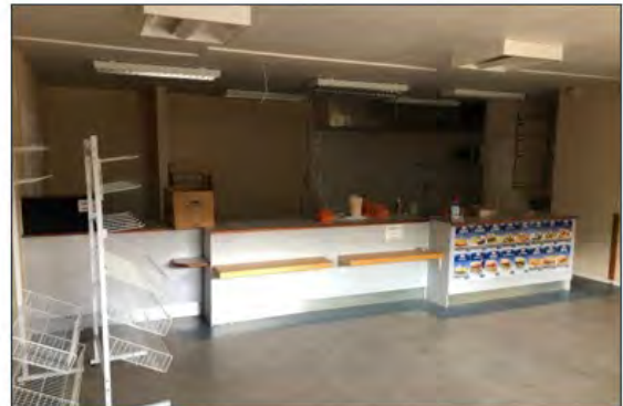
Figur 1 Løgstør busterminal i 1999 (tv) samt status i 2019 (th) hvor de betjente funktioner er lukket ned.

Mange busterminaler er pga. pladsbehov placeret i byens periferi på steder, der særligt i aften timerne kan opfattes som øde, hvilket også bidrager til en utryk oplevelse. Samtidigt er der ofte langt til de servicetilbud, der findes i byen, og som kunne benyttes i en naturlig forlængelse af en rejse med den kollektive trafik.