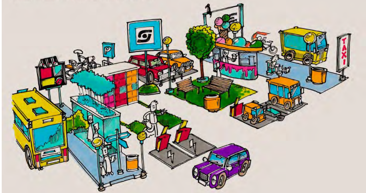
Figur 4 Illustration af fremtidens store knudepunkter. (Nordjyllands Trafikselskab, 2020)

Fremtidens terminaler skal rumme mange funktioner og fungerer som knudepunkter i borgernes hverdagsliv. Ud over at være knudepunkt i den kollektive trafik er det her, du henter dine pakker, oplader din el-bil eller køber en sandwich til din tur.