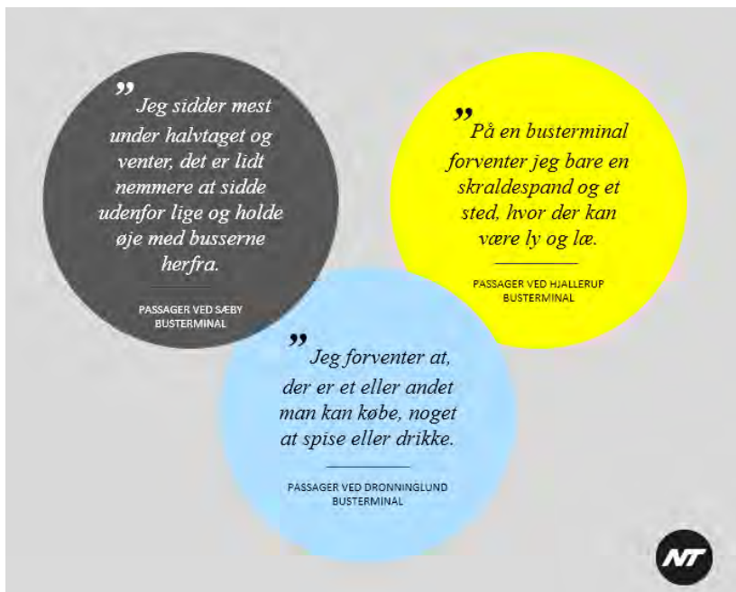
Figur 2 Citater fra passagerinterview. Vores services skal rumme mange forskellige typer af rejsende. Alt fra den vante pendler på vej til og fra uddannelse og arbejde, til den turist, der måske kun besøger Nordjylland en enkelt gang. Alle skal have en god og tryk rejse.

Erfaringerne viser, at mange kunder føler sig utrygge ved deres ophold på busterminalerne. De oplever ubehagelig og asocial opførsel fra andre, der benytter busterminalen til andre formål end ophold i forbindelse med den kollektive trafik. Det resulterer ofte i hærværk og problemer med at opretholde et acceptabelt serviceniveau for terminalernes faciliteter; særligt toiletterne.