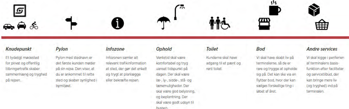
Figur 7 Kunderejsen igennem fremtidens knudepunkt

I det følgende præsenteres i katalogform de faciliteter, der kan optræde på en terminal. Kataloget rummer faciliteter af flere slags rettet mod både passagerer og chauffører. Konceptet gør det muligt at skræddersy den enkelte terminal til behovet i den enkelte by.