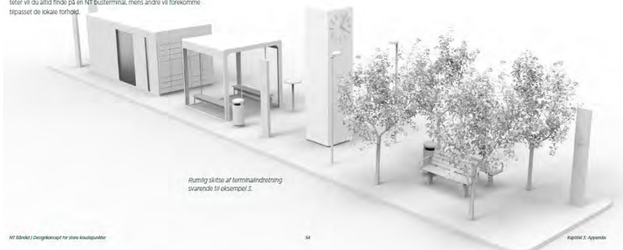
Figur 5 Illustration af NT båndet. Et fleksibelt areal med kundevedtatte faciliteter der kan tilpasses behovet på det enkelte sted (Nordjyllands Trafikselskab, 2020)

Typen og omfanget af udstyr kan tilpasses de arealer, der er til rådighed til de kundevedtatte faciliteter. På terminalerne findes der nogle basisfaciliteter, der er vigtige for rejsen med den kollektive trafik. Nogle faciliteter vil du altid finde på en NT busterminal, mens andre vil forekomme tilpasset de lokale forhold.