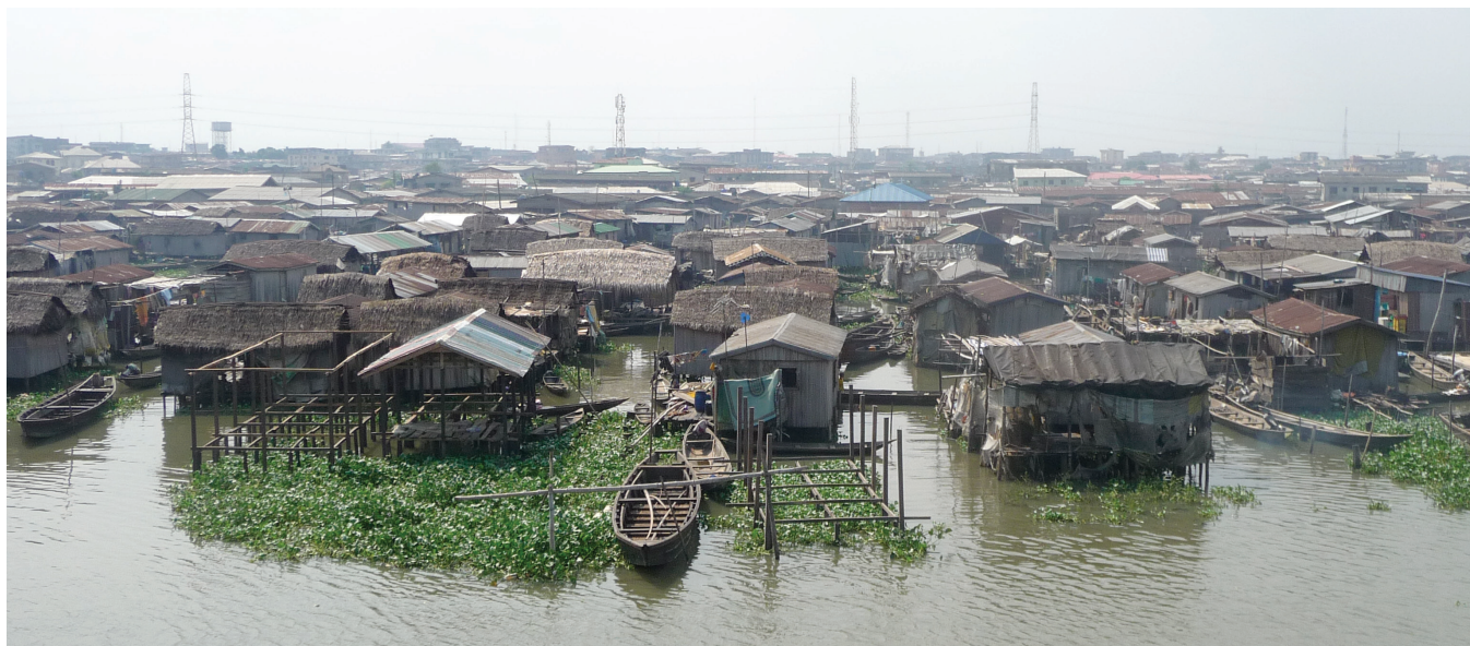
Figur 2. Lagos i Nigeria er en af de hurtigst voksende byer i verden med enorme slumområder.

Retten til en passende levestandard (adequate living, food and housing) har stærke relationer til planlægning og jordreformer. Uden sikre rettigheder til jord og fast ejendom må beboerne i slumområderne leve med en konstant risiko og frygt for at blive tvangsfjernet (forced eviction), da de ikke er officielt anerkendt som beboere i byen. Omkring 15 millioner mennesker bliver hvert år tvangsfjernet for at skabe plads til byudviklingsprojekter. FN's kommission for menneskerettigheder har udtalt, at "denne praksis med tvangsfjernelse udgør en groft overgreb på menneskerettigheder – specielt retten til en passende bolig" (UNCHR, 1993). Enhver tvangsfjernelse, hvad enten den er legal eller ej, påvirker menneskers liv og ødelægger de småsamfund og sociale netværk, som de er afhængige af i deres kamp for overlevelse. Derfor bør slumområder ses som en integreret del af den samlede planlægning for byområder, der bør omfatte en hel række af innovative planlægningsstilgange til at håndtere denne form for uformel bosætning (UN-Habitat, 2009; UN-Habitat/GLTN, 2010).