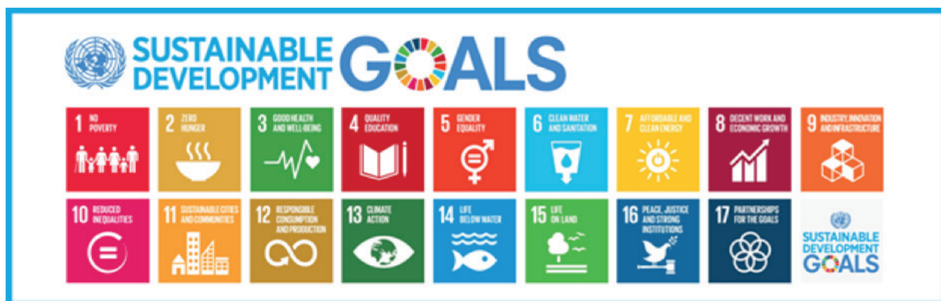
Figur 3. FN's 17 Verdensmål – de såkaldte Sustainable Development Goals.

Denne diskussion om den globale dagsorden i relation til menneskerettigheder pålægger også et