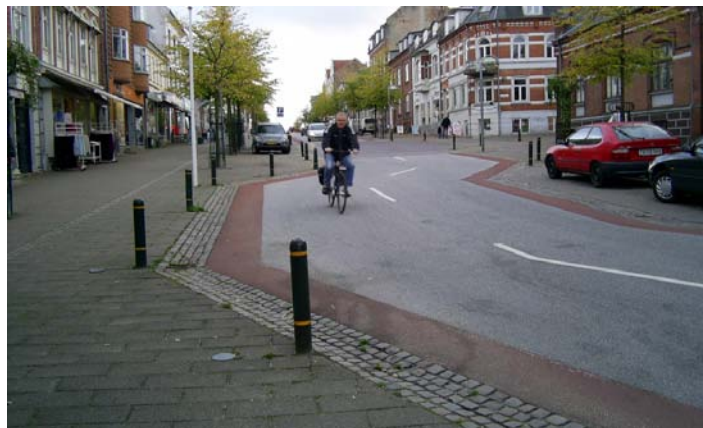
Figur 2. Adelgade i Skanderborg. Et eksempel på en projektlokalitet, hvor asfalkørebanelen er bevaret.