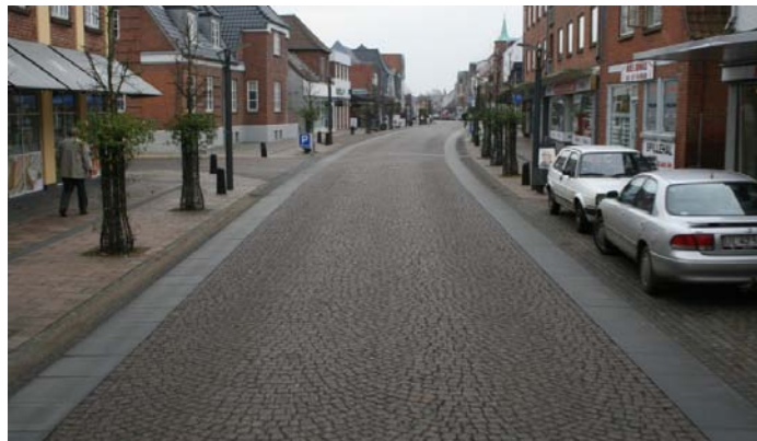
Figur 1. Storegade i Brande. Et eksempel på en af 14 projektlokaliteter, hvor asfalkørebanelen er udskiftet.