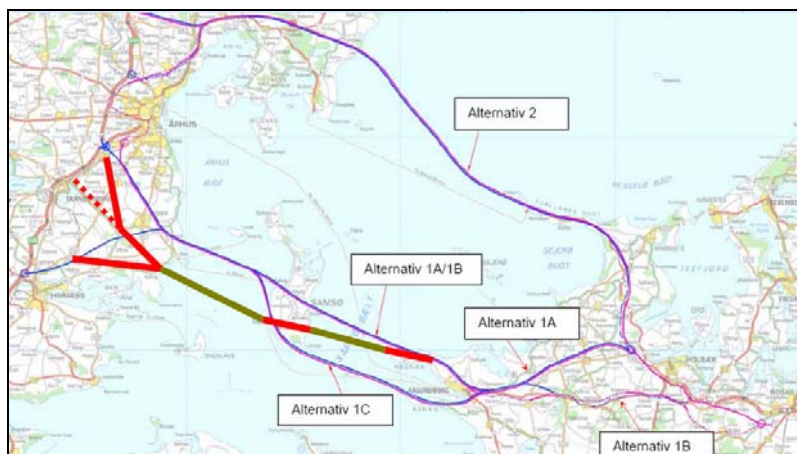
Fig. 2: Niras rapportens alternativer og et forløb over Svanegrunden

Niras rapporten analyserede linieføringsalternativerne 1A-C og Alternativ 2, som alle er markerede med lilla/blåt i den efterfølgende figur fra rapporten.