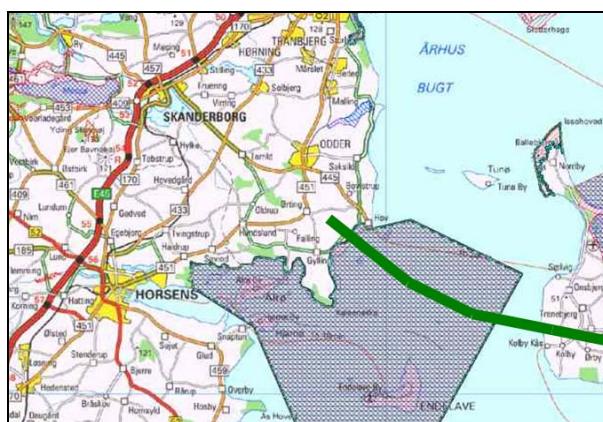
Fig. 3: Svanegrunden og Natura 2000 området

Et muligt forløb over Svanegrunden er markeret med en tyk grøn streg på figur 3: