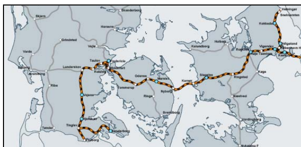
Fig. 1: Den elektrificerede del af banenettet

Det fremgår af den efterfølgende figur at den del af elektrificeringen, som var blevet gennemført i 1997 i koordinering med åbningen af den faste baneforbindelse over Storebælt, for Jyllands vedkommende kun omfattede hovedbanestrækningen mellem Fredericia/Taulov og Padborg, samt sidebanestrækningen Sønderborg-Tinglev.